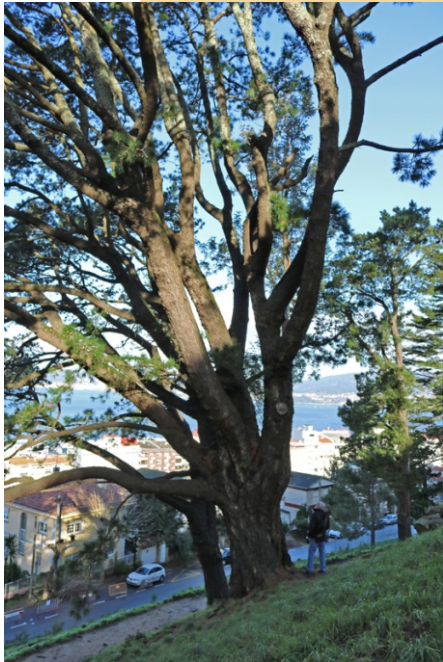
Piñeiro de Monterrei ( Pinus radiata ) de 4,5 m de perímetro.