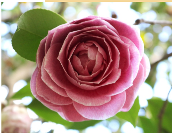
Camelia ( Camellia japonica )