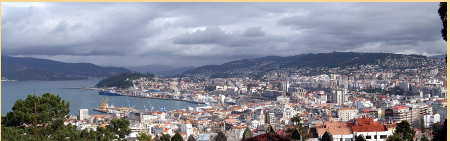
Vista de Vigo desde o Castelo do Castro