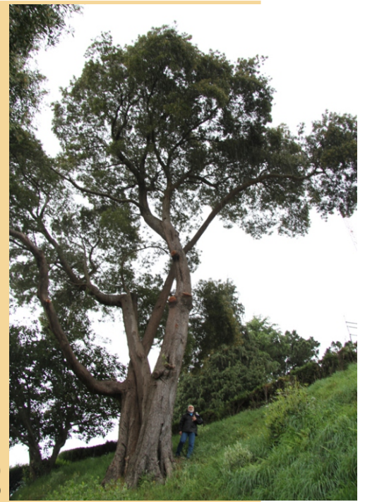
Acacia ( Acacia melanoxylon ) de 5,06 m de perímetro