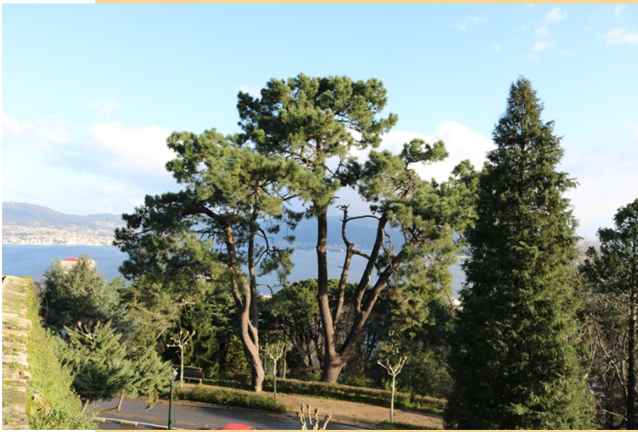
Piñeiros bravos ( Pinus pinaster )