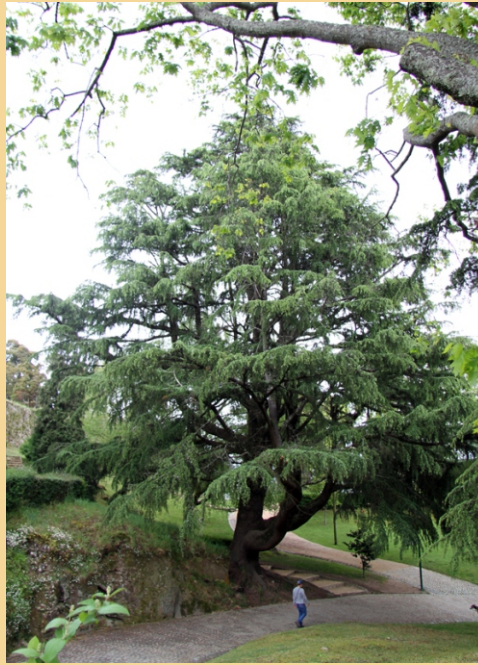
Cedro do libano ( Cedrus libani ) de 5,5 m de perímetro.