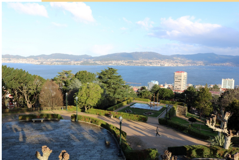
Miradoiro dos Galeóns de Rande