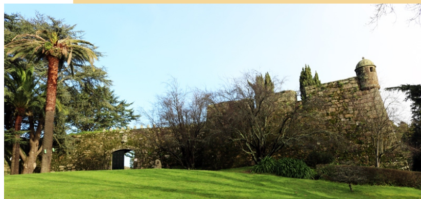
Entrada do recinto fortificado do Castro