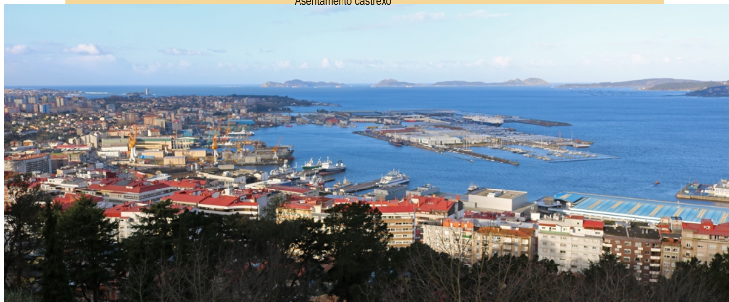
Vista da cidade e a ría